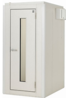
ヤマハ防音室 アビテックス「セフィーネ NS」