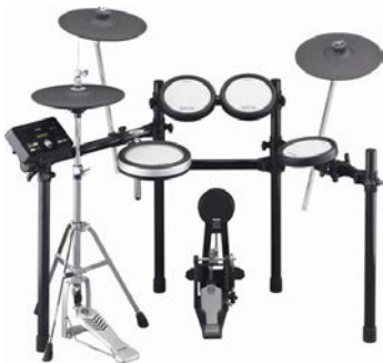
ヤマハ電子ドラム「DTX562KFS」