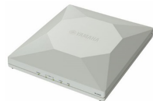
ヤマハ無線 LAN アクセスポイント「WLX402」